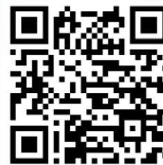
Dotazník pro žáky a studenty škol v Kyjově

Inzerce v Kyjovských novinách vám zajistí: