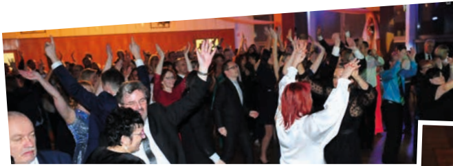
Exkluzivním hostem plesu byla kapela Abba Stars