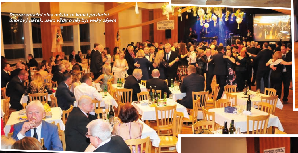
Reprezentační ples města se konal poslední únorový pátek. Jako vždy o něj byl velký zájem