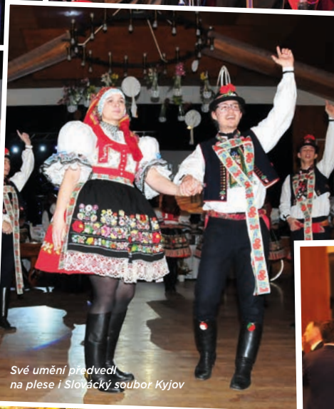
Své umění předvedli na plese i Slovácký soubor Kyjov