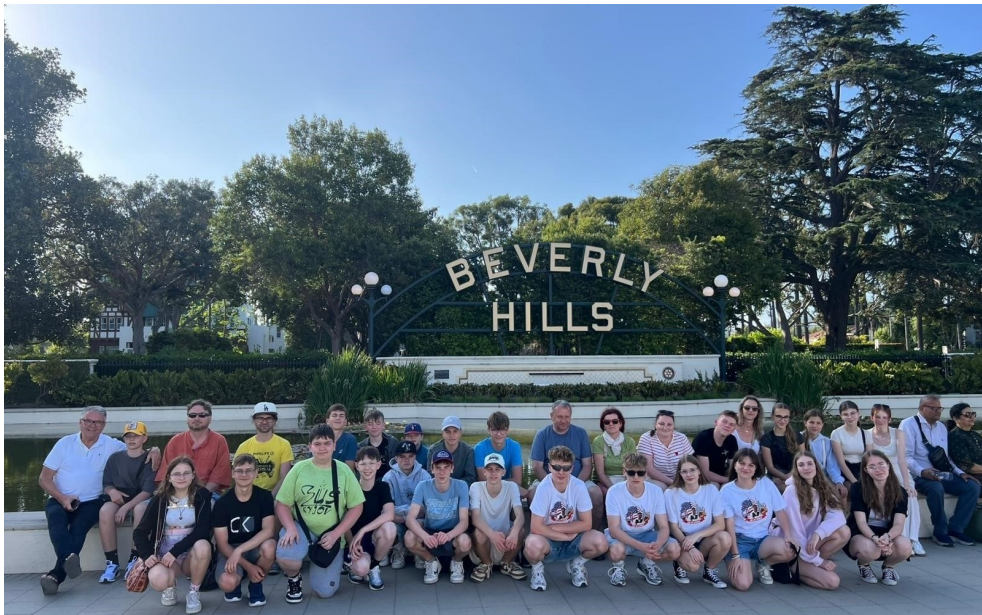
Mozartovy děti – sólisté ZUŠ Kyjov s Filharmonii Brno

Saturday, May 24, 2025, 2:00 PM Joslyn Community Center 1601 N. Valley Drive, Manhattan Beach, CA 90266