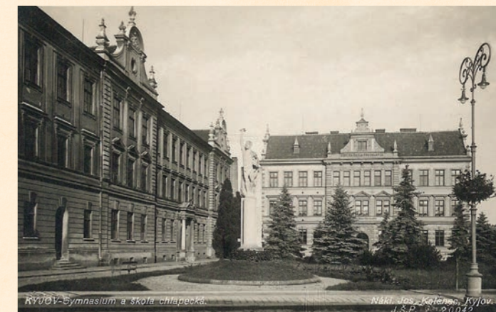
Gymnázium a obecná škola pro chlapce