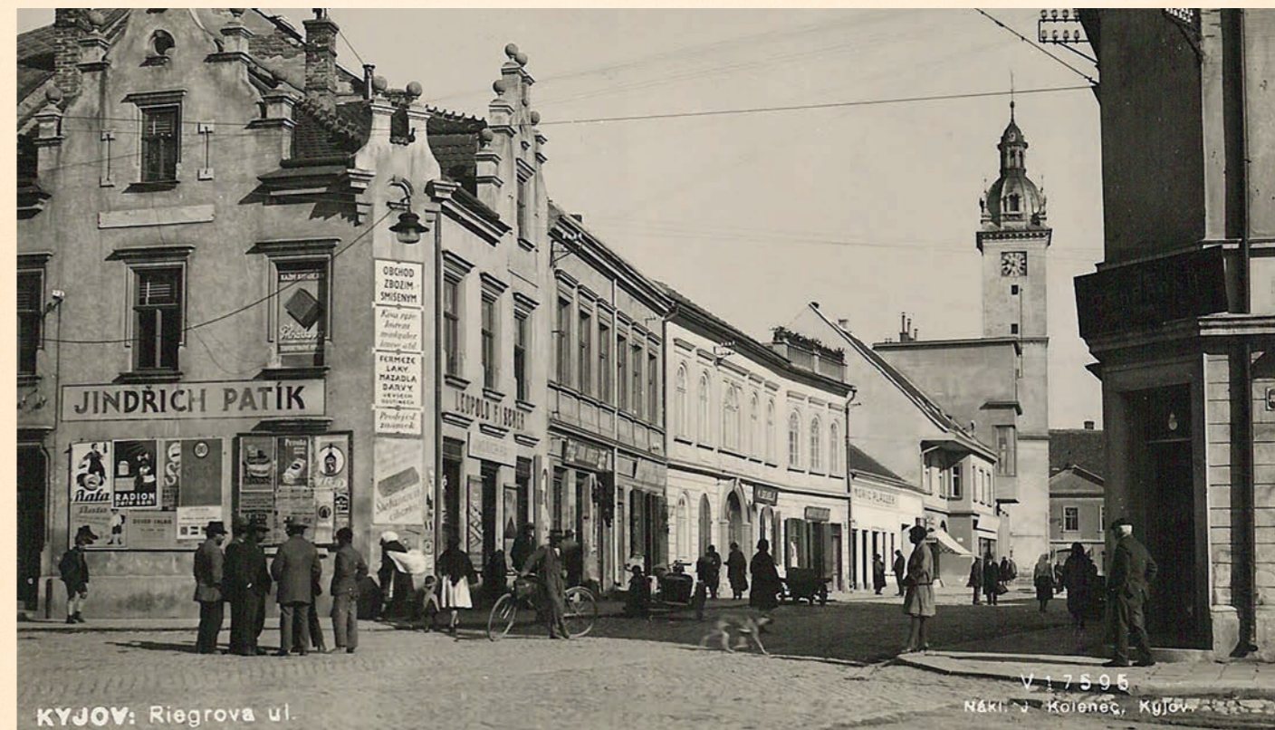
Riegrova ulice a její každodenní ruch.

Kyjov letos slaví 900 let od první písemné zmínky, a to je ideální příležitost vydat se na malý výlet do minulosti. Přinášíme vám výběr historických snímků, které zachycují město tak, jak vypadalo před desítkami let.