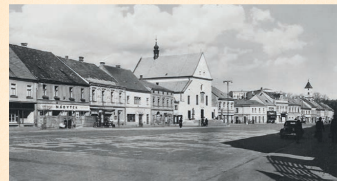
Pohled na část Masarykova náměstí