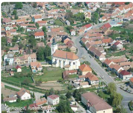
Čejkovice, ilustrační foto