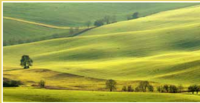
Obrázek č. 9: Výhled do krajiny z Babího lomu - vzdálenější solitérní hrušeň obklopená vlnami a liniemi. Příklad fotografie, na níž nízké světlo krajinu vymodeluje a vytvoří dojem plastičnosti.