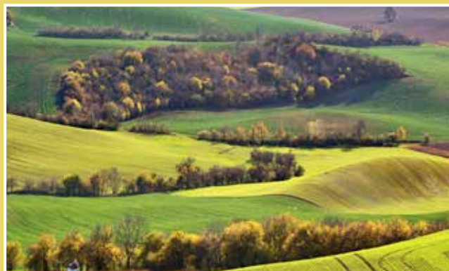
Obrázek č. 10: Výhled do krajiny z Babího lomu – krajina poskládaná „cikcak“. Příklad fotografie s trochu „širším“ záběrem na teleobjektiv