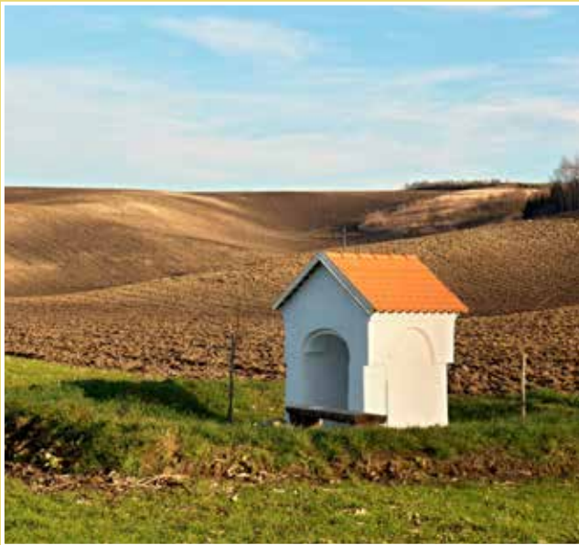
Obrázek č. 7: Kaplička Neposkvrněného početí Panny Marie

Další bio pásy najdete i na jiných místech v krajině, např. mezi Šardicemi a Hovorany a také pod Strážovicemi.