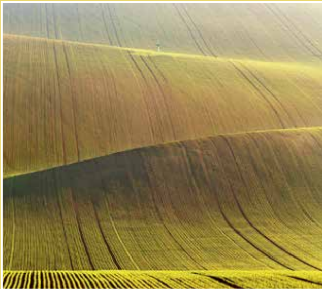
Obrázek č. 3: Jámy (jamy) – zvlněná pole nedaleko Šardic – strmost vln je umocněna propadem štoly