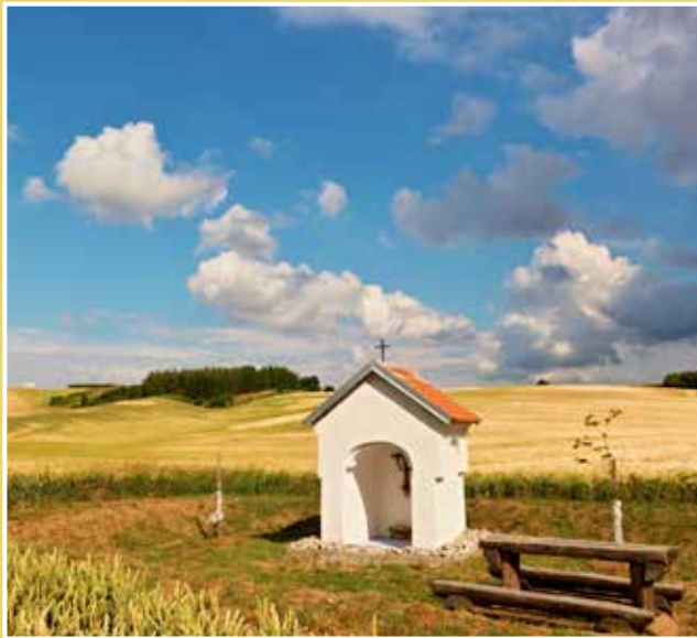
Obrázek č. 8: Kaplička Neposkvrněného početí Panny Marie