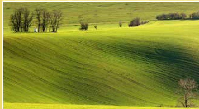
Obrázek č. 11: Výhled do krajiny z Babího lomu – kaplička sv. Barbory

Od kapličky pokračujete dále po asfaltové cestě, až přijedete k lesíku a vyjedete mírný kopec. Při výjezdu z lesa je po levé straně pomník věnovaný partyzánům, kteří zde byli na konci 2. sv. války popraveni nacisty. Po komunikaci přijedete až na křižovatku u Stavěšic a dáte se vpravo, kolem hřbitova nahoru. Nyní vás čeká nejnáročnější část, výjezd na kopec Babí lom. Stoupání nejprve není tak prudké, řádově 5-6%. Po asi kilometru jízdy přijedete na okraj vesnice Strážovice, vyjedete serpentinu, za kterou je stoupání strmější. Nejprudší je samotný závěr, příjezd k hlavní komunikaci, silnici I/54. Zde odbočíte vpravo a jedete po silnici směrem na Kyjov. Po pravé straně minete bývalý strážovský zámeček, ujedete asi kilometr a přijedete na konec Strážovic. Vpravo je skvělé výhledové místo do krajiny, která se vám otevře jako na dlaní. Za opravdu výjimečné viditelnosti, hlavně po přechodu studených front, bývají vidět i Alpy – Schneeberg, cca 180 km vzdušnou čarou.