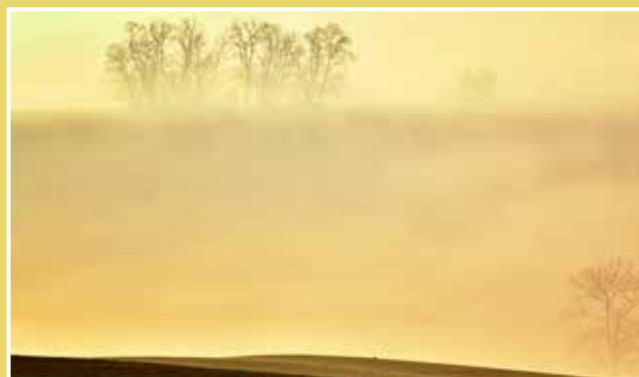
Obrázek č. 12: Výhled do krajiny z Babího lomu – kaplička sv. Barbory zahalena mlžným oparem. Příklad fotografie pořízené ráno po východu slunce, kdy kyjovská kotlina byla pod inverzní pokličkou a nahoře nad Strážovským kopcem panovalo krásné a slunné počasí.

6. foto zastávka - Kaplička sv. Petra a Pavla a kaplička sv. Barbory K následující foto zastávce a získání dalších krásných fotografií Moravského Toskánska nemusíte ujet další kilometry, stačí popojít kousek dále, upřít pozornost do krajiny pod vámi a zaměřit svůj fotoaparát na dvě kapličky. První, bližší, je kaplička sv. Petra a Pavla, která je tak trochu „utopená“ pod vlnou (fotografie č. 10) – zřejmě zde v minulosti vedla cesta, která byla v období kolektivizace přerována. Kolem remízků a kapliček se poměrně často pohybují volně žijící zvířata – srnky, zajáci, bažanti. Druhá, známější, je kaplička sv. Barbory (fotografie č. 11). Babí lom, kde se nacházíte, je nejvyšším kopcem Moravského Toskánska vůbec. Dá se odtud vyfotit a nakomponovat poměrně dost samostatných fotografií. Koncem léta a v podzimních měsících se za ranních mlh stává, že díky své výšce vyčnívá nad mlžnou pokličkou a dole v polích se povalují mlhy (fotografie č. 12). Dá se vyšplhat i nad dřevěnou stavbu, čímž se ještě zlepší periferie a výhled do kraje.