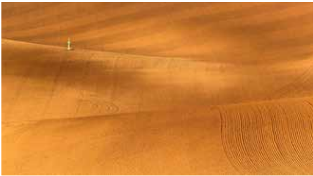
Obrázek č. 2: Jámy (jamy) – zvlněná pole nedaleko Šardic - zelený terčík v poli označuje stolu a její parametry

Výchozím bodem výletu je Informační centrum města Kyjova, odkud se vydáte vpravo na světelnou křižovatku k silnici I/54. Na ní zamíříte doleva a hned na další světelné křižovatce u autobusového nádraží zabočíte vpravo. Projedete rovně ulicí Jiráskova, přejedete železniční přejezd, odbočíte doprava a podle ukazatele směru přijedete k cyklostezce Mutěnka. Po ní pojedete až na druhé křížení s asfaltovou cestou ve Svatobořicích (cca po 4 km). Zde sjedete, zahnete vpravo (za restaurací Na nádraží) a přijedete na hlavní silnici II/422 u kulturního domu. Zahnete vlevo, projedete Mistřínem a pokračujete dál po silnici č. 422 směrem na Šardice. Po cca 2,5 km dorazíte k autovrakovišti „Rajčatárna“. Zde odbočíte z hlavní silnice č. 422 vpravo a vyjedete mírný kopec po úzké asfaltové cestě. Ta je určena primárně jako obslužná komunikace pro zemědělské účely, zákaz vjezdu automobilů na ní ale neplatí, proto je nutné věnovat jíždě zvýšenou pozornost. Přijedete k místu uskladnění bioodpadu. Zde je první foto zastávka.