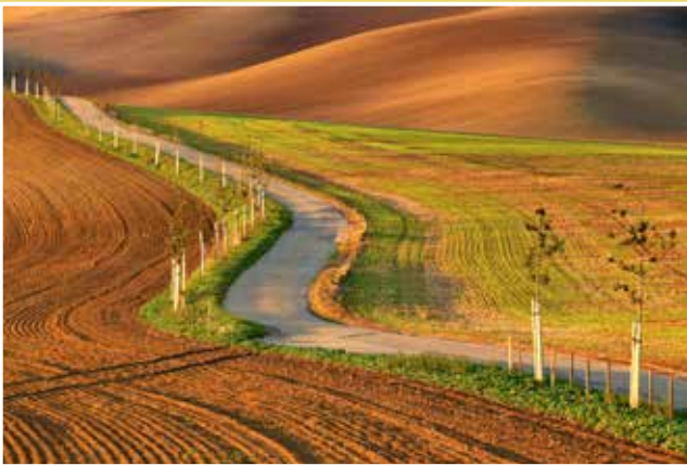
Obrázek č. 1: Asfaltová cesta pro zemědělské účely klikatící se mezi vlnami (propadající se štoly do důlní činnosti).

Trasa není náročná. Čeká vás jediný výraznější kopec, nazývaný Babí lom, známý spíše pod názvem „Stražovják“ - podle vesnice, která se na něm nachází. Pokud na něj pojedete ze směru od Stavěšic, není stoupání tak fyzicky náročné jako od Kyjova. Až na tento úsek se většinou jede po rovině, proto je trasa vhodná i pro méně zdatné jezdce. Celkem vás čeká asi 23 km a necelých 300 výškových metrů celkového stoupání.