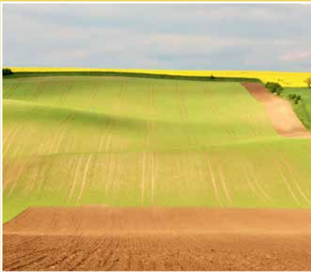
Obrázek č. 4: Jámy (jamy) - zvlněná pole nedaleko Šardic, kde se znatelně podepsala důlní činnost