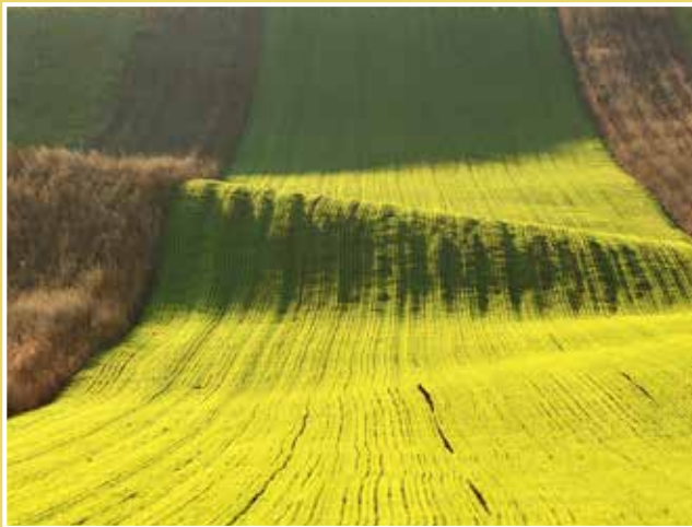
Obrázek č. 6: Bio pás