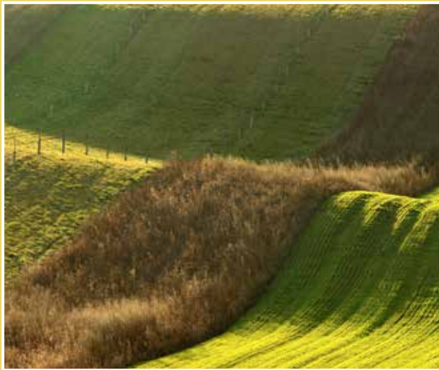
Obrázek č. 5: Bio pás

Popojedte několik set metrů dále a přijedete na další místo vhodné pro focení. Komunikace je zde rozšířená tak, aby se v méně přehledném terénu mohla vyhnout osobní auta. Na mnoha místech v poli uvidíte zelené terčíky označující stolu a její parametry.