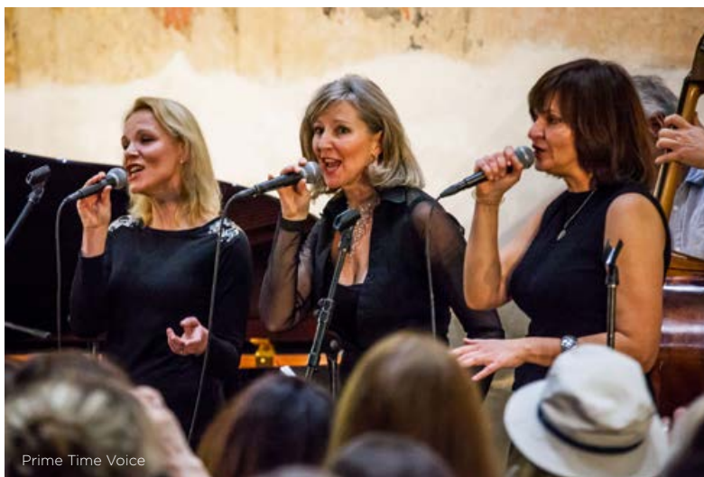
Prime Time Voice