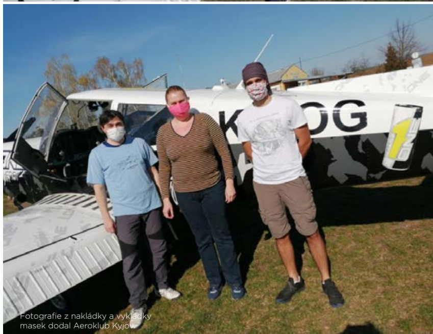
Fotografie z nakládky a vykládky masek