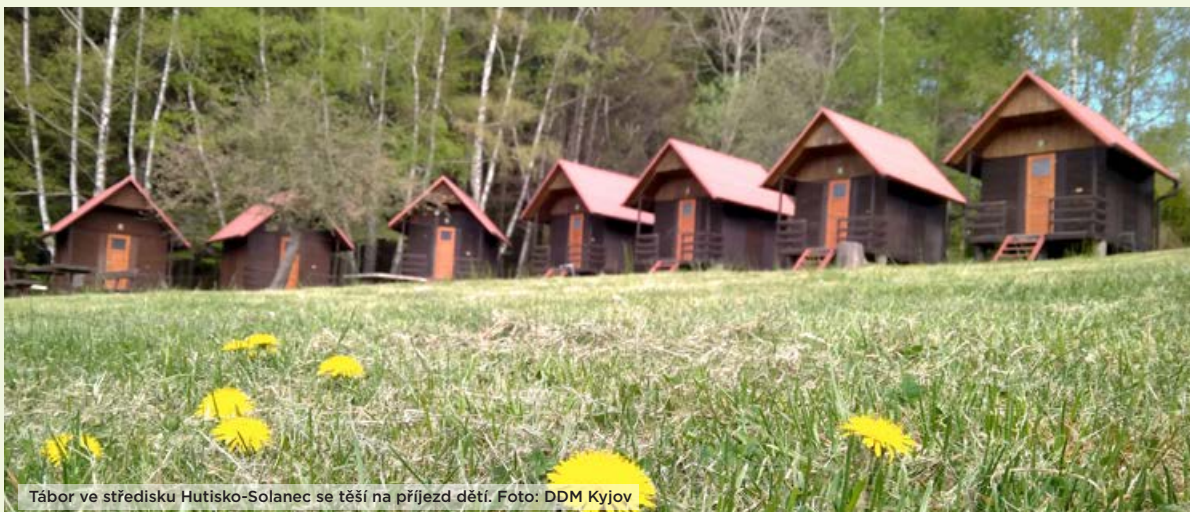
Tábor ve středisku Hutisko-Solanec se těší na příjezd dětí.