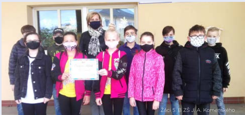
Žáci 5. B ZŠ J. A. Komenského