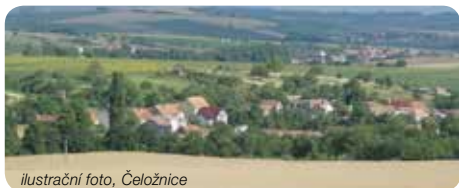
ilustrační foto, Čeložnice