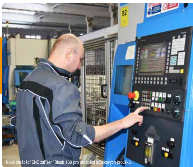
Nové obráběcí CNC zařízení Bisub 160 pro obrábění ložiskových kroužků.

www.sroubk.cz Šroubárna Kyjov, spol. s r.o.