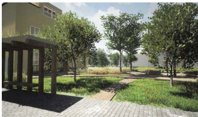
Foto vizualizace: Zamýšlená podoba úpravy prostoru před školou v Bohuslavicích.

Zastupitelé za Sedmadvacítku nezávislých