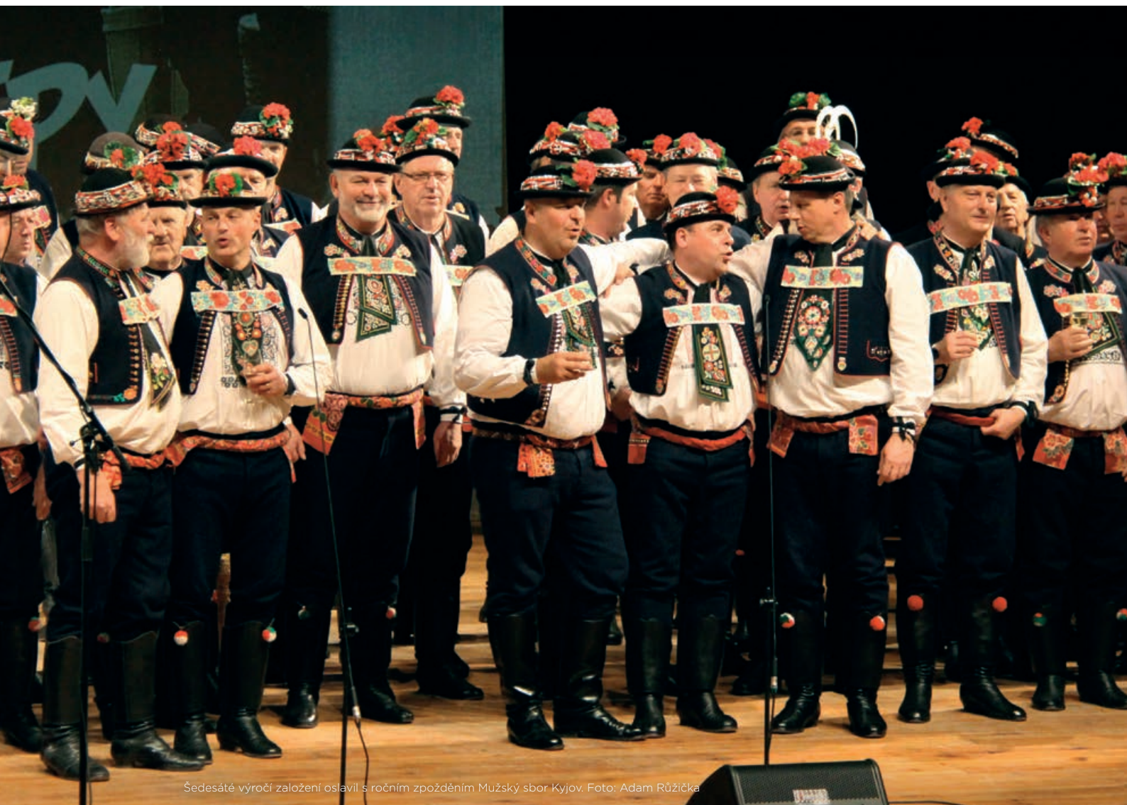
Šedesáté výročí založení oslavil s ročním zpožděním Mužský sbor Kyjov.

TAK TLUČE SRDCE NAŠEHO MĚSTA / VYDÁVÁ MĚSTO KYJOV / ZDARMA