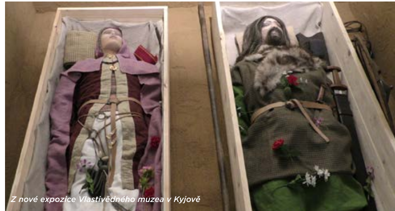
Z nové expozice Vlastivědného muzea v Kyjově

„Normálně to probíhá tak, že koncem března nebo začátkem dubna komise na svém zasedání vyhodnotí projekty dvoukolově. Nejdřív určí první desítku, kterou pak boduje a vybírá z ní oceněné projekty. Kolem 18. května, kdy je Mezinárodní den muzeí, dochází obvykle ke slavnostnímu vy-