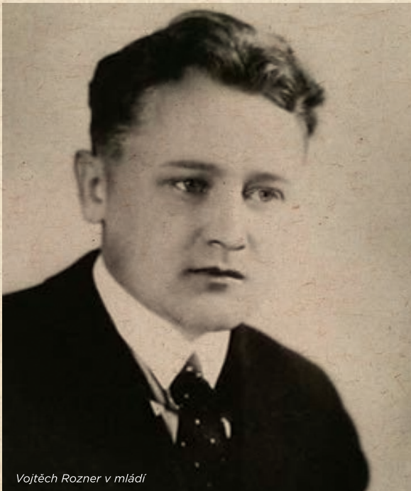
Vojtěch Rozner v mládí

ných kádrech“ za 1. světové války na Kyjovsku dostal státní cenu a jeho básnický epos Galánečka o dvanácti zpěvech si vysloužil cenu Akademie. O jeho oblíbenosti na Slovácku svědčí pět vydání. Vojtěch Rozner vydal i několik sbírek satirických veršů a epigramů. V politickém procesu byl odsouzen na 11 let do uranových dolů a propuštěn byl v roce 1960 na amnestii. Od té doby psal do šuplíku, pracoval jako dělník v textilce, žil v Liberci, kde se dočkal i rehabilitace po roce 1989, stal se členem Obce českých a moravských spisovatelů, ale vydání svých rukopisů se už nedožil. Zemřel 20. dubna 1991. V almanachu Návraty Kyjovska z roku 1991 zanechal vzpomínku na rodný kraj: Zpívající dědiny mého mládí.