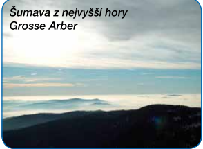
Šumava z nejvyšší hory Grosse Arber