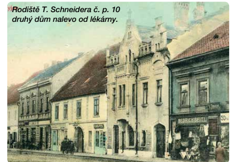
Rodiště T. Schneidera č. p. 10 druhý dům nalevo od lékárny.