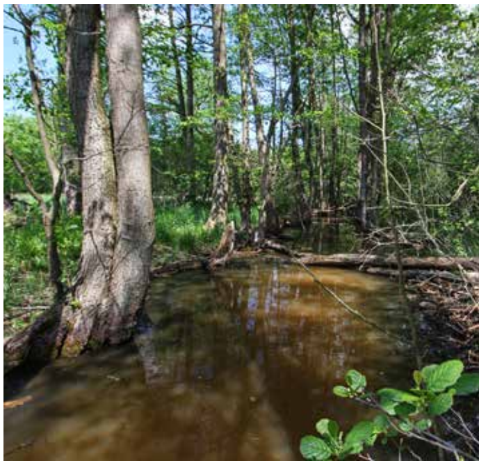
Kyjovka u Haluzic.

Řeka Kyjovka, jejíž horní tok je nazýván Stupava (nebo Stupavka), pramení na jižním svahu kopce Vlčák v Chříbech (540 m n. m.) a odtud teče přes malebné Staré Hutě a obec Stupavu. Mezi Vršavou a Lysou horou byla vybudována vodní nádrž Koryčany, která od roku 1963 slouží jako zdroj pitné vody pro oblast Kyjovska a zároveň reguluje průtok řeky.