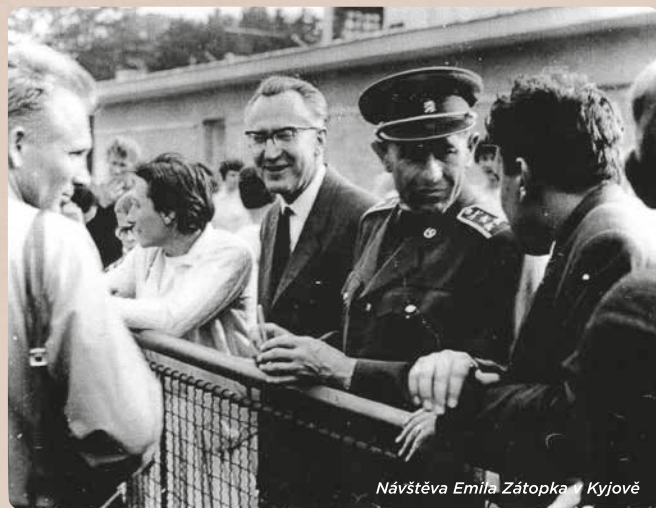
Návštěva Emila Zátopka v Kyjově