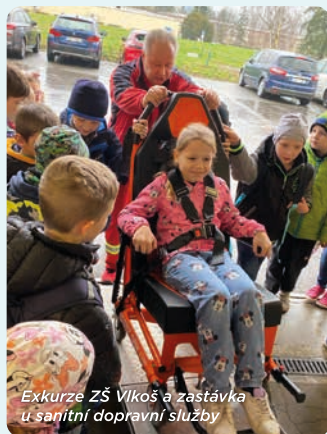
Exkurze ZŠ Vikoš a zastávka u sanitní dopravní služby

Kontaktujte nás: hollerova.veronika@nemkyj.cz