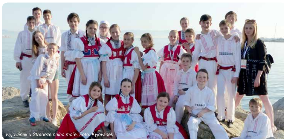
Kyjovánek u Středozemního moře.