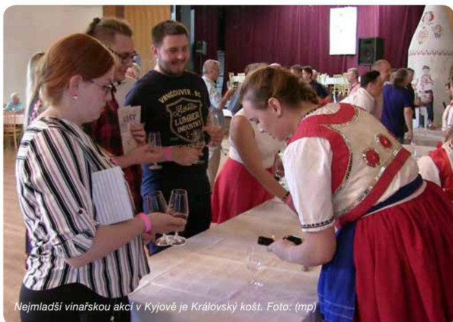
Nejmłodší vinařskou akcí v Kyjově je Královský košt.

Prodám stavební míchačku na kolečkách. Tel.: 777 756 468.