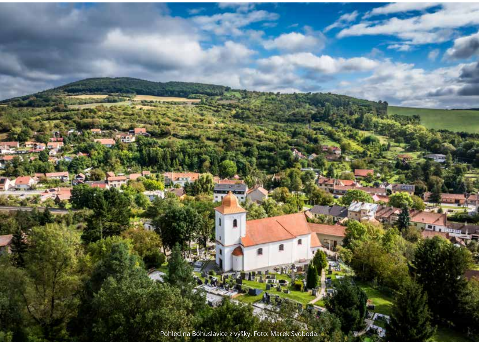
Pohled na Bohuslavice z výšky.

TAK TLUČE SRDCE NAŠEHO MĚSTA / VYDÁVÁ MĚSTO KYJOV / ZDARMA