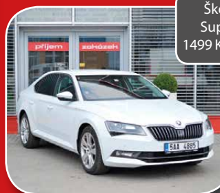
Škoda Superb 1499 Kč / den