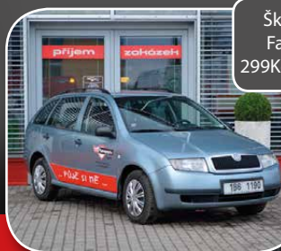
Škoda Fabia 299 Kč / den