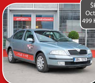
Škoda Octavia II. 499 Kč / den