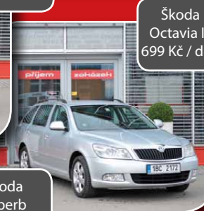
Škoda Octavia II. 699 Kč / den