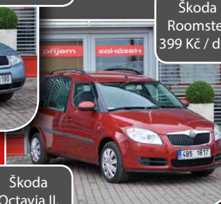
Škoda Roomster 399 Kč / den