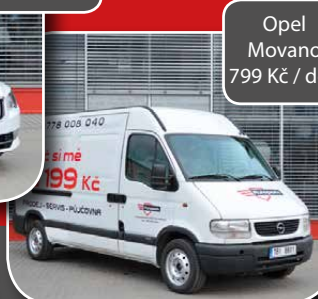
Opel Movano 799 Kč / den

A nezapomeňte, léto se blíží a zimní pneu se rychle sjíždí!