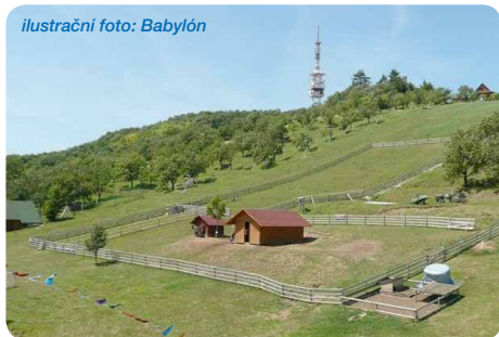
ilustrační foto: Babylón